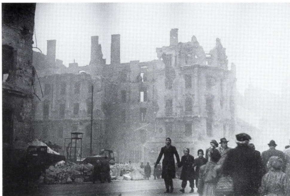
A Ferenc körút és az Üllői út kereszteződése 1956. november 4. után

„«Rettenetes mézárítások mentek végbe, 30 ember halt ott meg hirtelen ...»”