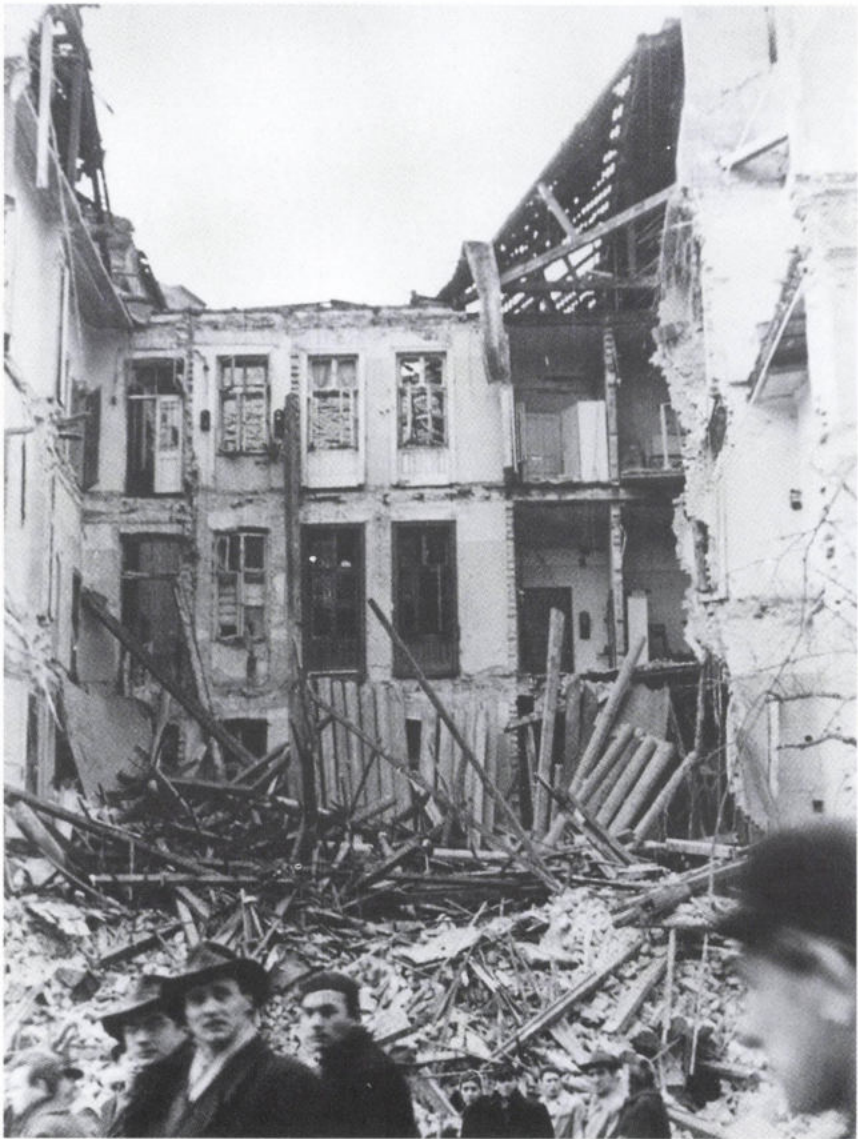
Szétlőtt ház a József körúton 1956. november 9.

„... Kötszerre, gyógyszerre, élelemre, cigarettára lenne szükségünk, valamint lőszerre, taposóaknára, páncélöklökre, rádió adó-vevőre ...»”