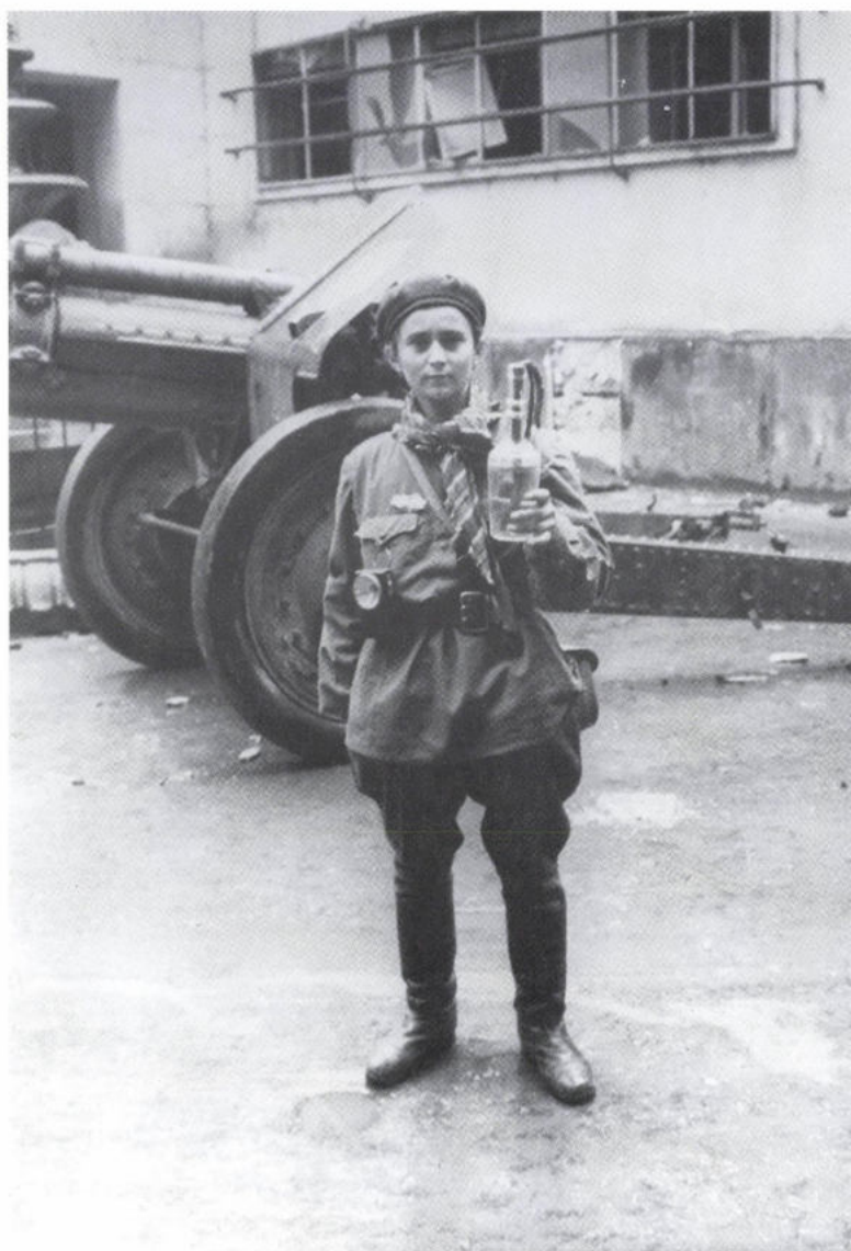
Felkelő leány a Corvin közben, kezében Molotov-koktél 1956. november 1.

„... a testvéri Magyarországon reakciós és ellenforradalmi erők lázadást szítottak ..., hogy visszaállítsák a régi földesúri-kapitalista rendet.»