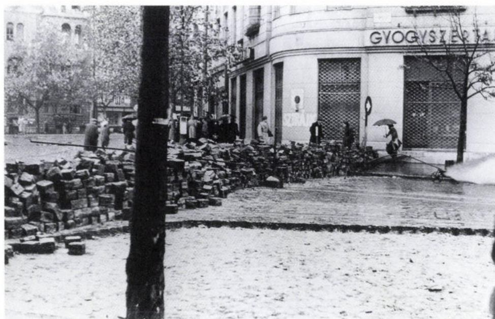
Barikád a Móricz Zsigmond körtéren, a Villányi út torkolatánál 1956. október 28. körül

„A legtöbb felkelő nyugati vagy ENSZ-támogatásra számítva tartott ki az óriási túlerővel szemben.”