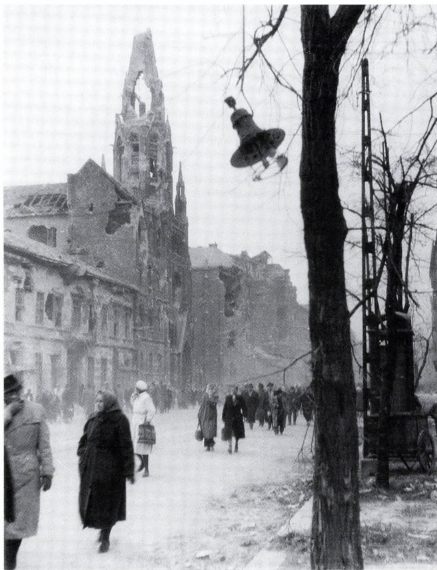
A romos Üllői út az Örökimádás templomával 1956. november 4. után

„... nekünk semmiféle ellentétünk a tankokban ülő, egyszerű katonával nem volt.»”